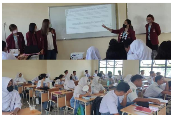
Gambar 1. Proses sosialisasi dengan presentasi materi

Kegiatan sosialisasi ini telah dilaksanakan dengan baik. Kegiatan ini dilakukan untuk meningkatkan kebijakan siswa-siswi SMA dalam menggunakan sosial media agar tidak muncul indikasi dalam melakukan cyberbullying . Selain itu, kegiatan ini juga dapat meningkatkan ketertarikan serta minat siswa-siswi dalam mempelajari ilmu Social Media Analysis atau Psikologi. Selama melakukan presentasi, melibatkan komunikasi dua arah antara presenter dengan audiens. Komunikasi dua arah tersebut, seperti perkenalan diri oleh beberapa audiens, aktif mendengarkan, serta pemberian kuis untuk mengetahui pemahaman siswa mengenai materi yang diberikan.