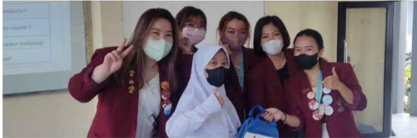
Gambar 2. Pemberian reward kuis

Saat sesi kuis dilakukan, diberikan tiga pertanyaan mengenai materi serta kesan pesan sosialisasi dari sepasang siswa. Berdasarkan observasi kami, para murid antusias menjawab. Tiga pertanyaan kuis yang diberikan, diantaranya: (1) apa saja manfaat dari social media analysis ?; (2) Berapa aspek dampak pada korban cyberbullying ?; (3) Bagaimana cara menanggulangi cyberbullying ? Dari pertanyaan pertama, siswa dapat menjelaskan dengan baik manfaat dari sosial media, yang salah satunya untuk bersosialisasi. Pertanyaan kedua juga dibalas dengan jawaban tepat, dapat mengulangi dari lima aspek yang diberikan pada materi. Pertanyaan terakhir dijawab dengan tindakan konkrit, seperti menggunakan penyaringan komen.