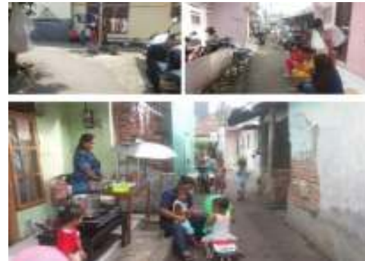
Gambar 11. Ruang Interaksi pada Koridor Dalam

penulis terkait ruang interaksi sosial pada selasar koridor dalam