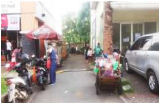
Gambar 4. Pintu Masuk Selatan Kampung Rumpak Sinang

Terdapat juga ruang interaksi yang bersifat tidak tetap dan berubah yakni selasar rumah dan toko warga. Terakhir adalah poros tengah yang terdapat pos penjagaan bagi masyarakat kampung ini dan hanya beroperasi saat malam hari.