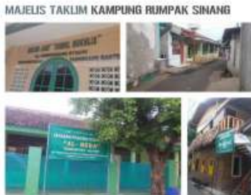
Gambar 10. Majelis Taklim Kampung Rumpak Sinang

lapangan ini, dan apabila ada bantuan dari luar kawasan Kampung Rumpak Sinang, warga akan mengambil bantuan mereka di lapangan ini.