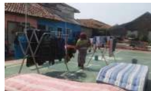
Gambar 9. Lapangan Bersama RW 02

Pada lapangan pada RW 02 (gambar 9), terlihat aktivitas warga lebih dominan, dimana terdapat berbagai aktivitas di lapangan seperti ibu-ibu yang menjadikan area lapangan sebagai area mengeringkan pakaian, dan pada saat sore hari digunakan sebagai area latihan sepak bola oleh para remaja. Kondisi fisik lapangan juga tampak baik dan mendukung kegiatan. Lapangan pada kantor Kelurahan Pakulonon Barat biasanya digunakan oleh karang taruna untuk melakukan berbagai kegiatan remaja, acara 17-an di