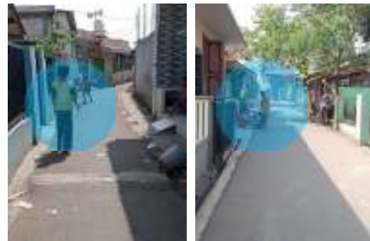
Gambar 12. Aktivitas anak-anak dan remaja pada koridor jalan