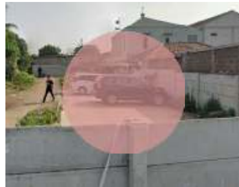
Gambar 8. Lapangan Bersama RW 01

Lapangan yang ada di Kampung Rumpak Sinang berjumlah dua (2) lapangan dan berada pada masing-masing RW. Lapangan pada RW 01 (gambar 8) pada umumnya tidak terpakai dan menjadi lapangan parkir. Masyarakat lebih banyak berinteraksi di selasar rumah dan anak-anak bermain di area jalan umum serta selasar. Kondisi lapangan pada RW 01 juga kurang terawat karena akses menuju lapangan yang tertutup oleh tembok pembatas dan terdapat rumput-rumput yang dibiarkan tumbuh secara liar pada area lapangan sehingga rasa kepemilikan lapangan menjadi kurang terasa.