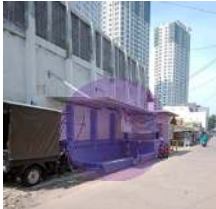
Gambar 6. Poros Tengah Kampung Rumpak Sinang