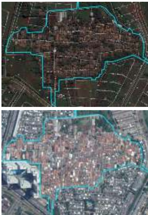
Gambar 1. Citra Satelit Kampung Rumpak Sinang tahun 2004 (atas) dan 2020 (bawah).

Namun pada beberapa kasus, lahan yang akan dibangun ternyata sudah dihuni oleh masyarakat lokal dengan kepemilikan tanah milik leluhur, sebagai contoh Kawasan Gading Serpong, Kabupaten Tangerang. Kawasan pengembangan yang hanya berjarak 35 km dari DKI Jakarta ini dikuasai oleh dua perusahaan properti besar yakni PT. Summarecon Agung Tbk dan PT. Paramount Enterprise International. Di kawasan Gading Serpong terdapat beberapa kampung yang telah ada sejak zaman leluhur, salah satunya adalah Kampung Rumpak Sinang, Kelurahan Pakulonan Barat, Kecamatan Kelapa Dua. Lokasi kampung ini berada di tengah kawasan pengembangan Gading Serpong.