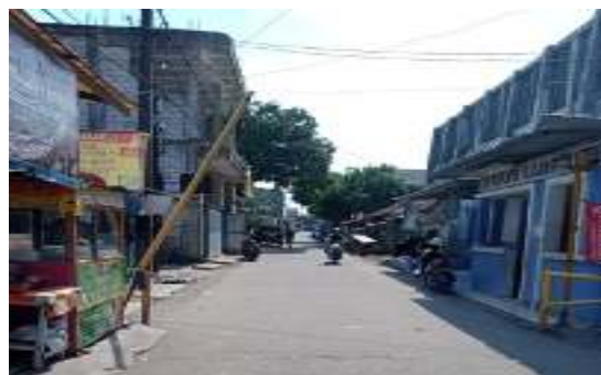
Gambar 3. Area Pintu Masuk Kampung Rumpak Sinang, Sumber: Dokumentasi Pribadi, 2020

Walaupun masyarakat kampung mengadopsi kehidupan masyarakat Gading Serpong dengan adanya konsep baru lingkungan kampung dengan munculnya portal penjagaan dan batasan-batasan yang dibuat antara luar kawasan dan dalam kawasan kampung, tetapi masyarakat kampung masih sangat menjalin hubungan erat satu sama lain.